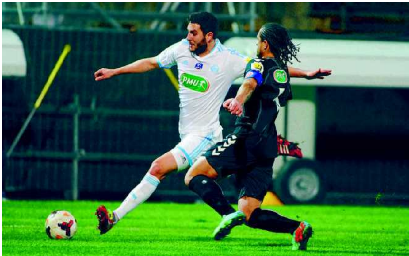
André-Pierre Gignac a marqué les deux buts de l'OM hier soir.

Toutefois, la météo a eu raison de deux matchs. A commencer par celui du PSG. Les hommes de Laurent Blanc qui devaient affronter Brest (L2) hier après-midi, joueront finalement demain soir. La rencontre avait été reportée en raison