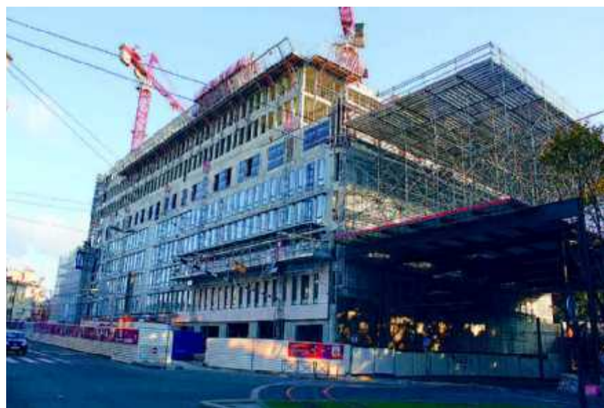
La Cité Municipale accueillera 800 agents de la Ville dès septembre prochain