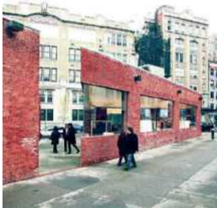
Nature et structures délicatement intriquées pour le Pavillon japonais de la Biennale de Venise 2008, ballon carré géant au Musée d'art contemporain de Tokyo, angles improbables dans les rues de New York, il ose tout, Ishigami - ou presque : réalisées ou pas, ses maquettes sont à voir à Arc en rêve.