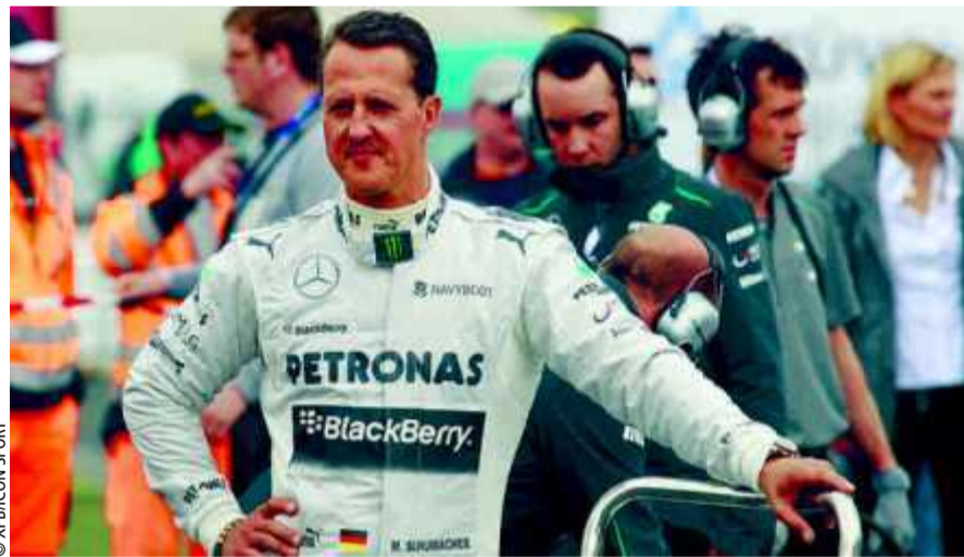
Michael Schumacher, en mai dernier.

Le mystère reste entier. Une semaine après son accident de ski à Méribel, Michael Schumacher est toujours plongé dans le coma entre la vie et la mort, au CHU de Grenoble. Si son état de santé demeure incertain, les circonstances de sa chute suscitent également des interrogations. A commencer par le lieu. Situé entre une piste rouge et bleue, le secteur «hors piste» aurait souffert d'un défaut de signalisation et de balisage. Si l'enquête prouve ces manquements, le maire, responsable de la sécurité, et l'exploitant du domaine skiable, responsable des pistes, pourraient être inquiétés en cas de