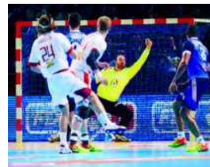
Hier à Paris-Bercy.

C'était la seconde de trop. L'équipe de France s'est inclinée de justesse face au Danemark (28-29) hier à Paris, lors de la deuxième journée de la Golden League. Face au vice-champion du monde qui défendra son titre continental à l'occasion du championnat d'Europe qu'il organisera dans quelques jours sur son sol (12-26 janvier), les hommes de Claude Onesta ont livré une belle bataille malgré la défaite. Après avoir battu le Qatar la veille dans la difficulté (29-23), les Tricolores ont cette fois-ci montré un visage plus séduisant mais ont dû s'incliner sur un tir de Mikkel Hansen dans les derniers instants de la rencontre. Les Bleus disputeront leur dernière rencontre de la compétition demain au Mans (Sarthe) face à la Norvège. •