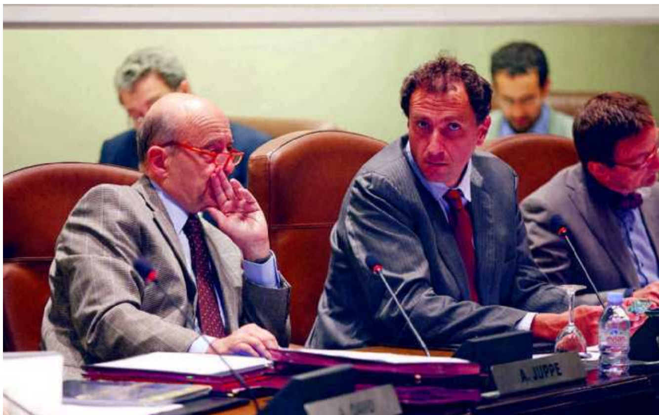
Les 23 et 30 mars prochain, Alain Juppé et Vincent Feltesse, entre autres, se disputeront le siège de maire de Bordeaux

En attendant la future ligne D, qui va relier la place des Quinconces à Eysines en passant par Bruges et le Bouscat, et dont les travaux devraient commencer au premier trimestre, plusieurs lignes existantes sont prolongées cette année. La ligne C desservira à partir du 1 er février la station Berges du Lac dans le